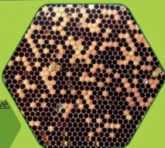
Photo 1 prise au moment de la 1ère utilisation avec BEESTRONG ® avril 2015. Un couvain sévèrement disséminé est observé.