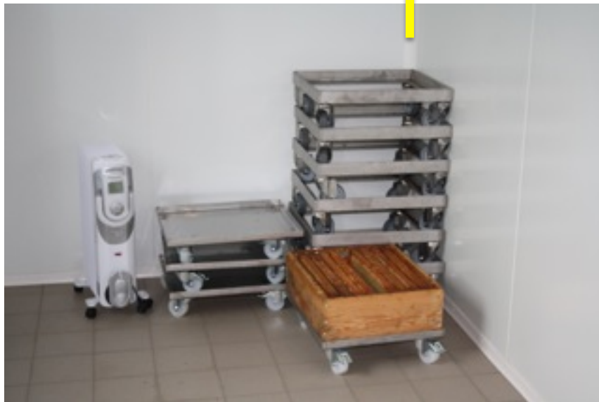
Première pièce pour l'arrivée de hausses, plateau à roulettes et déshumidificateur