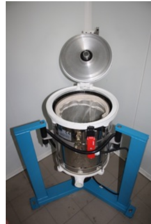
Passage du miel cristallisé pour le rendre crémeux sans chauffage