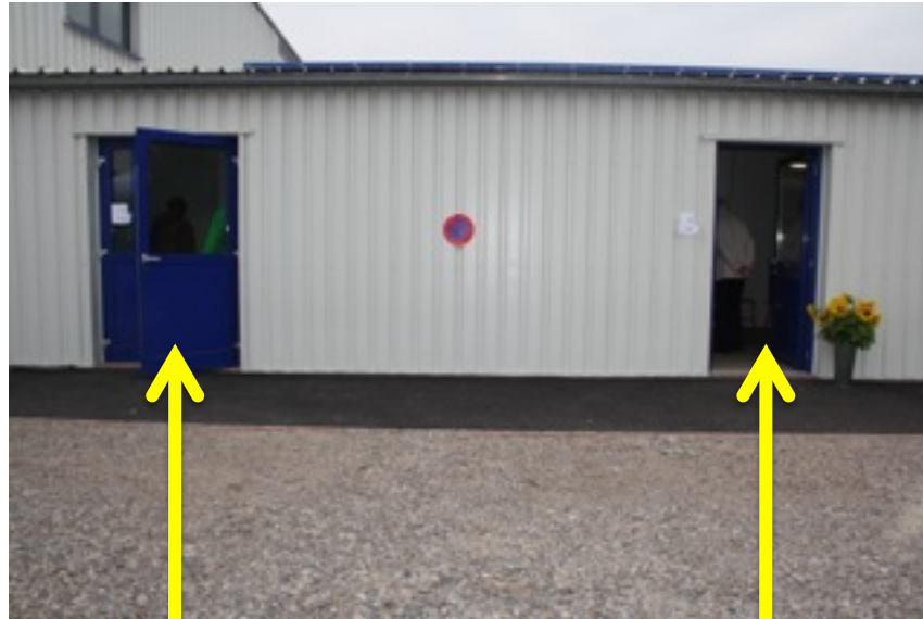
↑ Local atelier, cire et future réunion