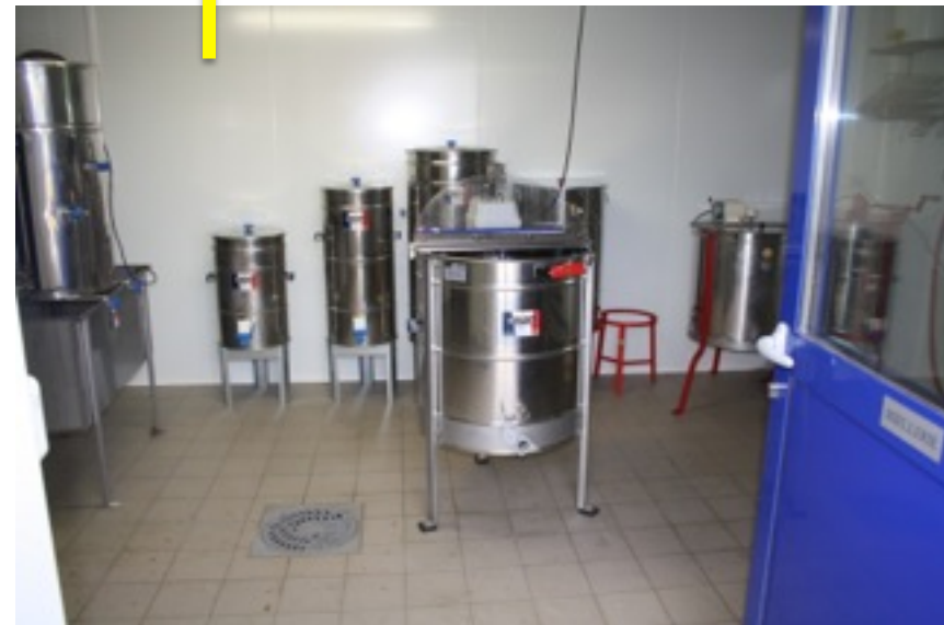
Tout le matériel de désoperculation, centrifugation et de maturation