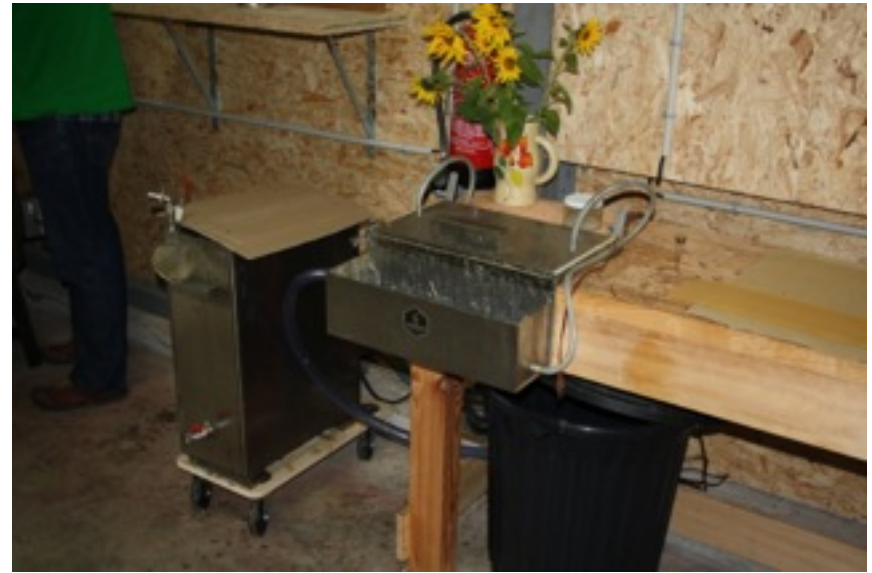
Premier poste de réalisation de cires gaufrées