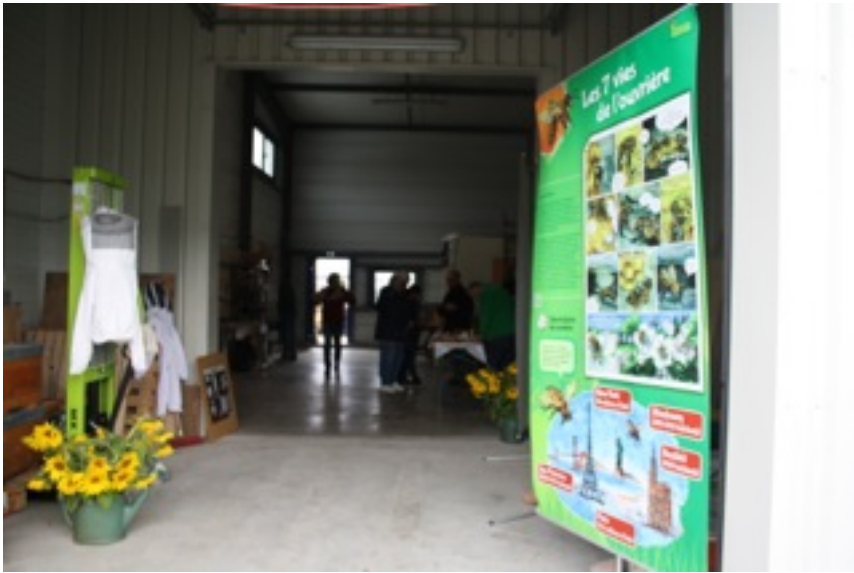
Premier local atelier et traitement de la cire